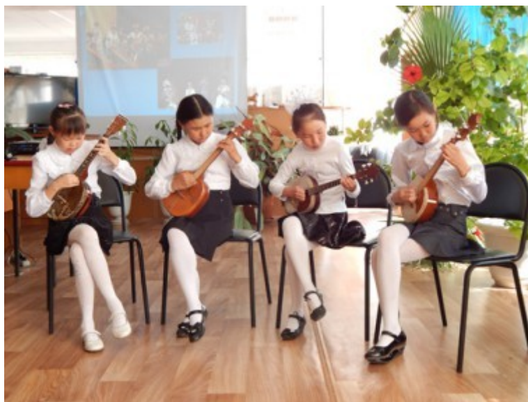
ДШИ ансамбль чанзисток