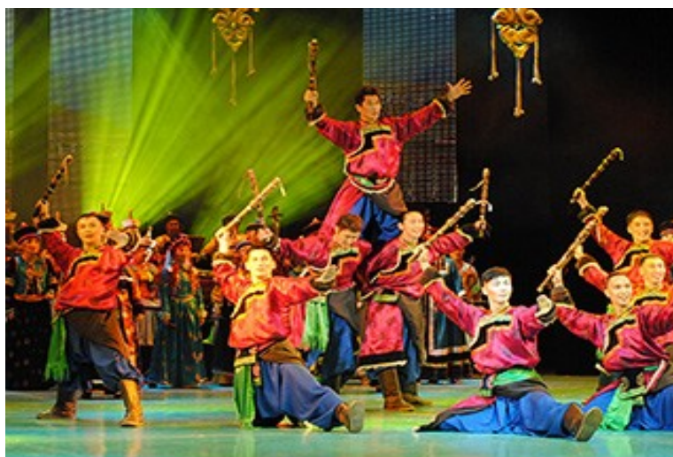
Бурятский ордена Ленина государственный академический театр оперы и балета имени Г. Ц. Цыдынжапова — музыкальный театр в г. Улан-Удэ.